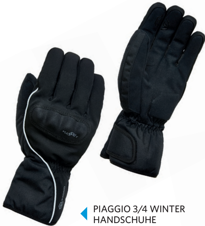
PIAGGIO 3/4 WINTER HANDSCHUHE