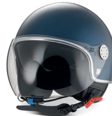
BLUETOOTH MIRROR HELM