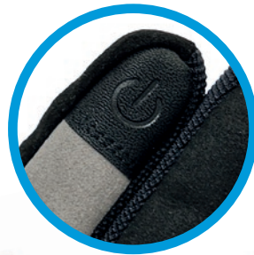
PIAGGIO SUMMER „TOUCH“ HANDSCHUHE